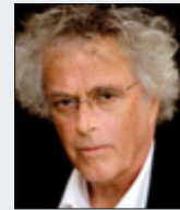
Dag Solstad, forfatter

Utmerket historieformidling, som jeg bare kan anbefale.