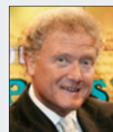
Dan Børge Akerø, entertainer

Historielærerenes kilde til utfyllende kunnskap og inspirerte avsporinger i undervisninga!